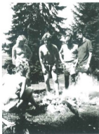
Scho zu dääre Zyt immer d Naase z vorderscht, wennis ums füürle goot: dr Mull.