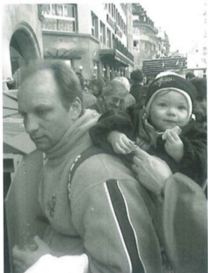
Apéro, Apéro ... ... an jedem traffe mir e huffe Lüt wo mir kenne – das isch super!