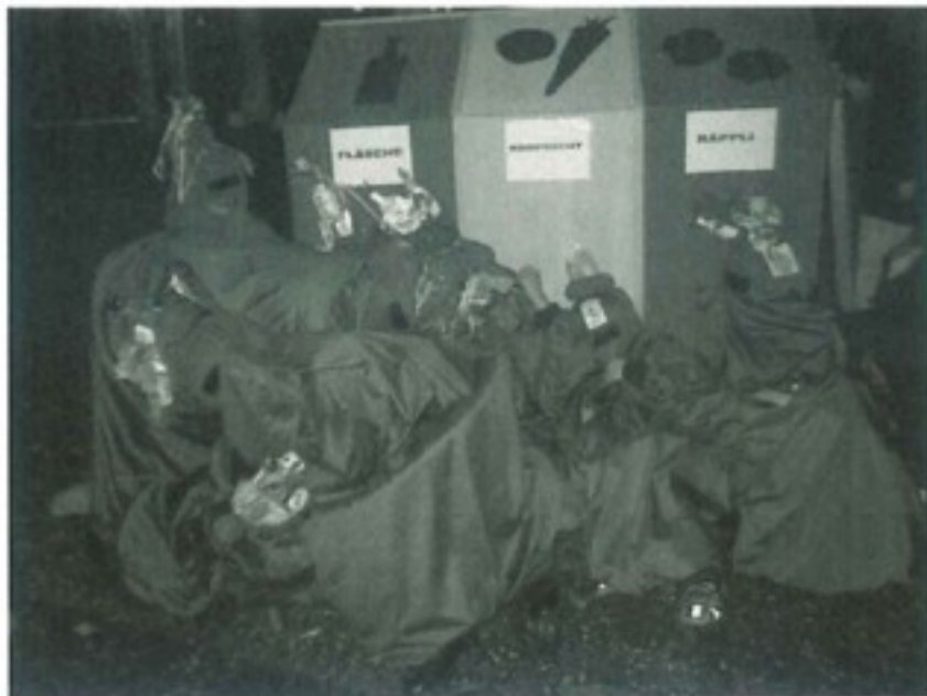
D Luftschnapperli-Fraue: e «scheene» Sauhuffe!