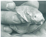
Dr „Mull“ läbt in Kolonie vo 70 bis 100 Artgenosse im Untergrund und grabbt sich durch e harte Savanneboode in Kenia, Äthiopie oder Somalia.

... dass e tatsächlich e Tierli git, wo Mull haisst? Genau gnoo „Nacktmull“. Lut em seriööse Magazin Spiegel wird das Viich wie folgt beschriibe: „Der Nacktmull ist ein nacktes, runzliges, rosafarbenes, Schnurrbart tragendes Nagetier mit Überbiss, das mit dem Ruf durch das Leben geht, es sei das hässlichste Tier der Welt.“ Also bi allem Respägg, mir finde das Tierli het nit unbedingt Ähnligkait mit unserem Mull. Wenn me allerdings die Zeenli ewägg dänggt, bestoot eventuell e gwüssi Vergleichbarkait mit sym Piffli – oder?