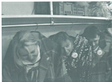
E Duurehänger am Zyschtig zoobe???

Dr Zeedel Ussgoob '04: E Mischig us Schnitzelbangg und ... ebbe Zeedel.