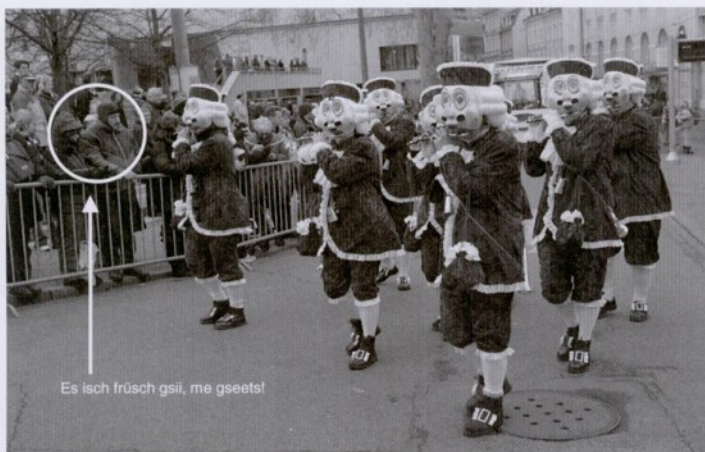
S Requist 2005: „Hau-Rugg, Hau-Rugg, fescht heebe mit dr Hand, s Sailzieh zwische Stadt und Land.“