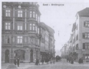
Oobe: Bligg vom Claraplatz in d Gryffegass. Unde: vom Claraplatz Richtig Clarastroos. Um 1900.