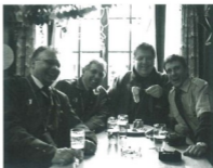
E guet gluunts Grüppli im Bruune Mutz bim Apéro vor em Mändigs-Cortège: E Räuber (mit Gnaagi) und drey Schugger.

„Im Schutte gänn si uns efang uff d Gugge, drfir löön sich die dr Böögg lo mugge!“ Das isch Suschéé 2007 gsii. Die glyychi Idee kunnt vom Ruthli und vom Marco. Dr Böög im Zentrum vom Sujet het denn au optisch alles yberraggt. E imposante Schneemaa uf em Schliiterhuffe het unser Requisit ziert.