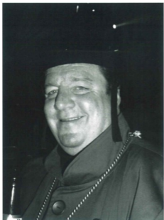
Jä was jetzt? Räuber oder Rabbi?