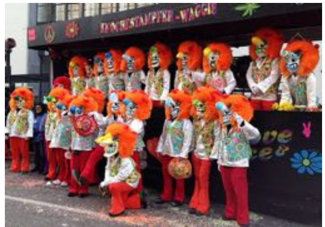
Knochestamper-Waggis Faasnacht 2018.