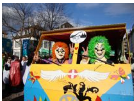
E bitz Nostalgii: 2010, Sujet Woodstock und s grossartigste Requisit, wo mr je baut hänn: Unsere Hippie-Bus.