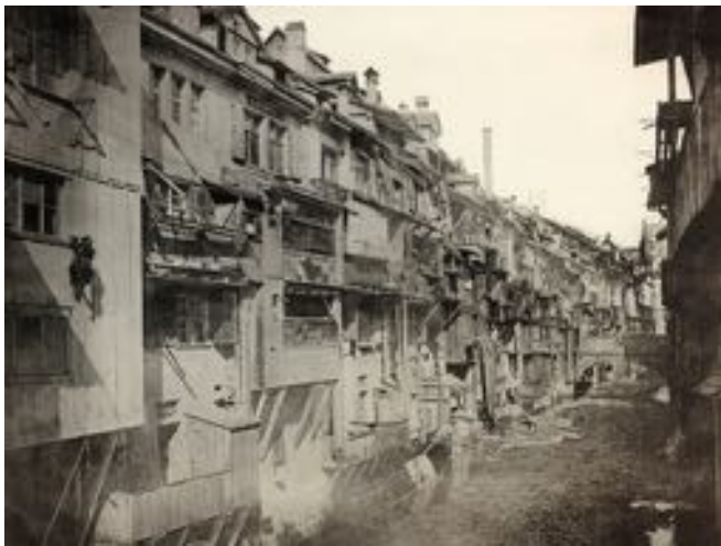
E Zyt, wo me no via Plumskloo in Birsig gaggelet het ..... Und au suscht e bitz „entsorgt“ het.