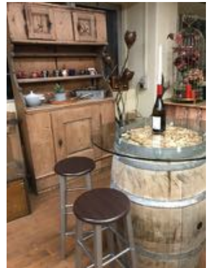
Alli drei Bilder: Doo häämmer dr Abschluss vo unserem Herbstbummel verbrocht.