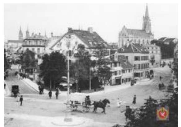
E Bild vo 1900: D Heuwoogkrüzig. Links goots in d Steinevorstadt und rächts in Steinentorstroos.